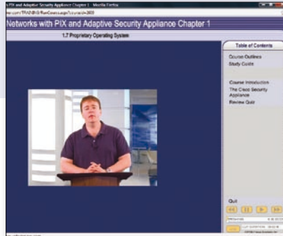
Afbeelding 3. Cursussen zijn opgebouwd als een virtueel college